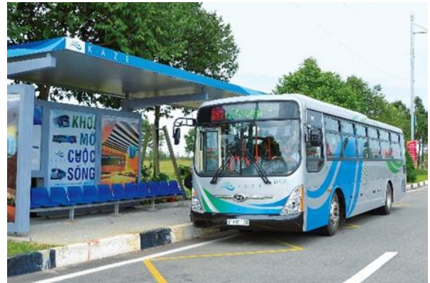
▲ Tuyến xe buýt “KAZE Shuttles”