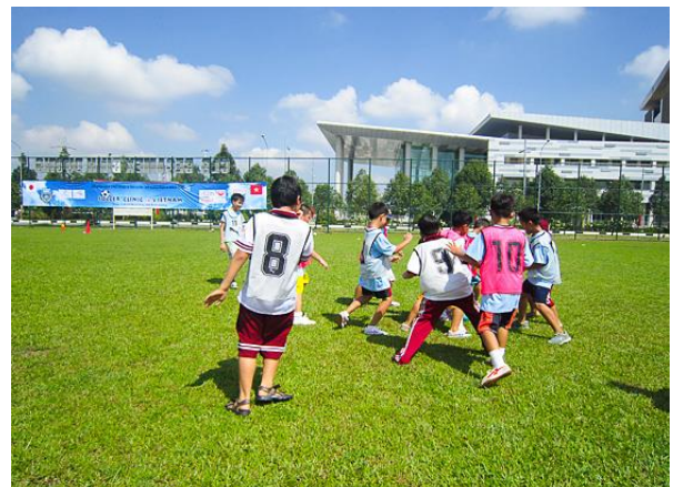
▲ KAWASAKI FRONTALE Football Clinic tại Việt Nam (năm 2014)