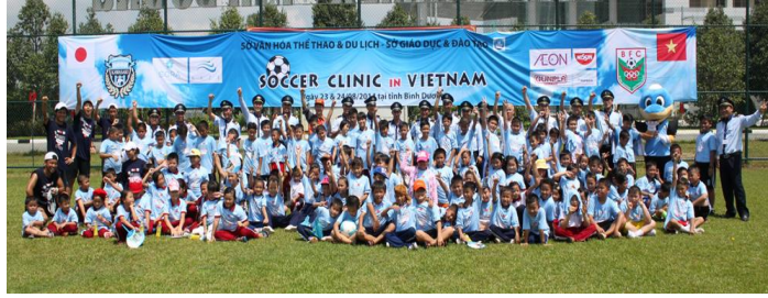
▲ KAWASAKI FRONTALE Football Clinic tại Việt Nam (năm 2014)