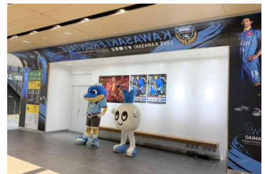
▲Trang trí tường của phòng chờ bên trong cửa soát vé của ga Musashi-Kosugi (Ảnh chụp tháng 10/2019)

Ngoài ra, một phần bề mặt tường của phòng chờ bên trong cổng soát vé tại ga Musashi-Kosugi được trang trí bằng hình ảnh các cầu thủ KAWASAKI FRONTALE