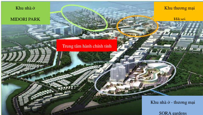
▲ Hình ảnh tổng thể phát triển Thành phố Mới Bình Dương

Từ năm 2012, TOKYU đã phát triển tại Thành phố mới Bình Dương (tổng diện tích 1,000 ha) các dự án nhà ở cao tầng và thấp tầng, các khu vực thương mại. Năm 2014 bắt đầu đưa vào vận hành các tuyến buýt là phương tiện giao thông công cộng phục vụ cho người dân Thành phố mới Bình Dương.