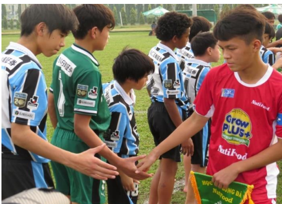
▲ KAWASAKI FRONTALE U-13 Vietnam Expedition (năm 2017)