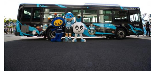
▲KAWASAKI FRONTALE Wrapping Bus

KAWASAKI FRONTALE Home Game được thực hiện với mục đích khuấy động không khí tại các khu vực. Từ sự kiện này, chiếc xe KAWASAKI FRONTALE Wrapping Bus đã ra đời, hoạt động như những xe buýt thông thường hoặc xe buýt đưa đón sân bay, vận hành xung quanh thành phố Kawasaki ngay cả khi không có các sự kiện Home Game