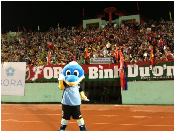
▲ Giải đấu TOKYU Binh Duong Garden City 2013 (năm 2013)

Từ 2018~2020 Tổ chức hoạt động thăm các cô nhi viện (tại Thành phố Đà Nẵng và Tỉnh Bình Dương)