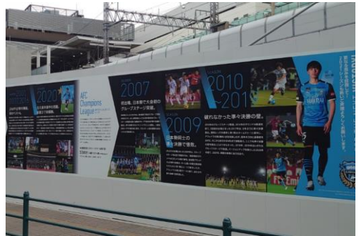
▲Kengo History Wall / 2021 Season Guide (dự kiến)

Ngoài ra, hiện tại KAWASAKI FRONTALE cũng đang trưng bày nội dung 4 giải đấu mà đội sẽ tham gia trong năm 2021