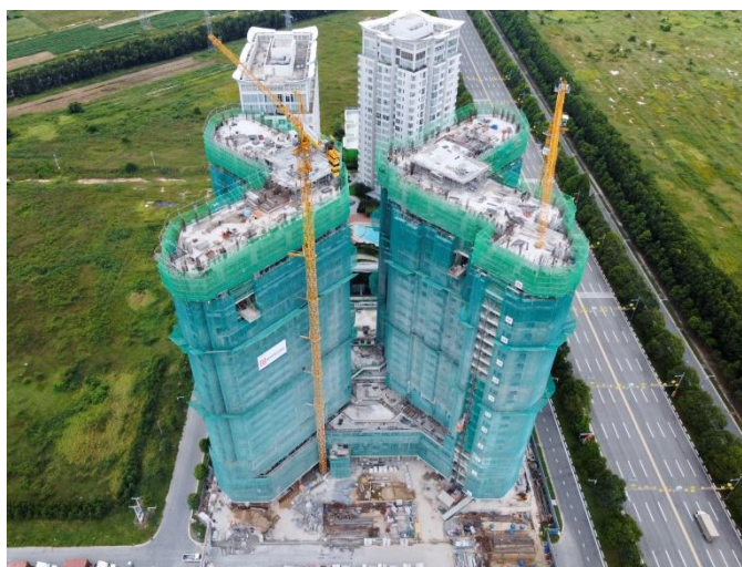
Hình ảnh công trình đến ngày 30/9