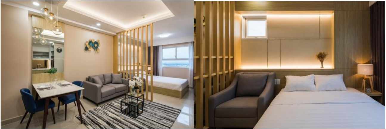
Căn hộ 1 phòng ngủ (Hình bên trái: phòng khách, hình bên phải: phòng ngủ)