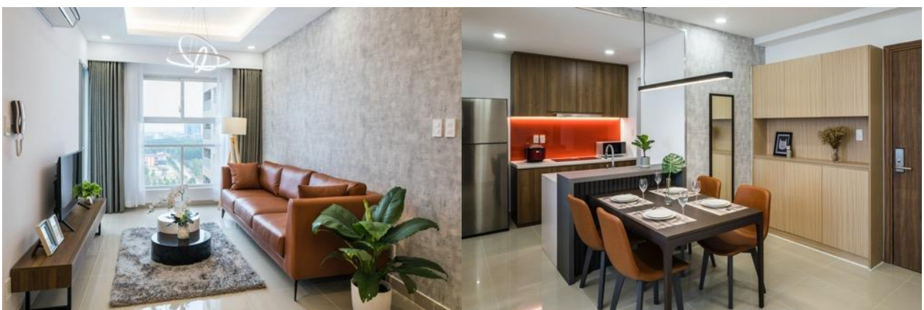
Căn hộ 2 phòng ngủ (Hình bên trái: phòng khách, hình bên phải: phòng ăn)