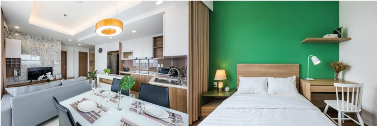
Căn hộ 3 phòng ngủ (Hình bên trái: phòng khách, hình bên phải: phòng ngủ)