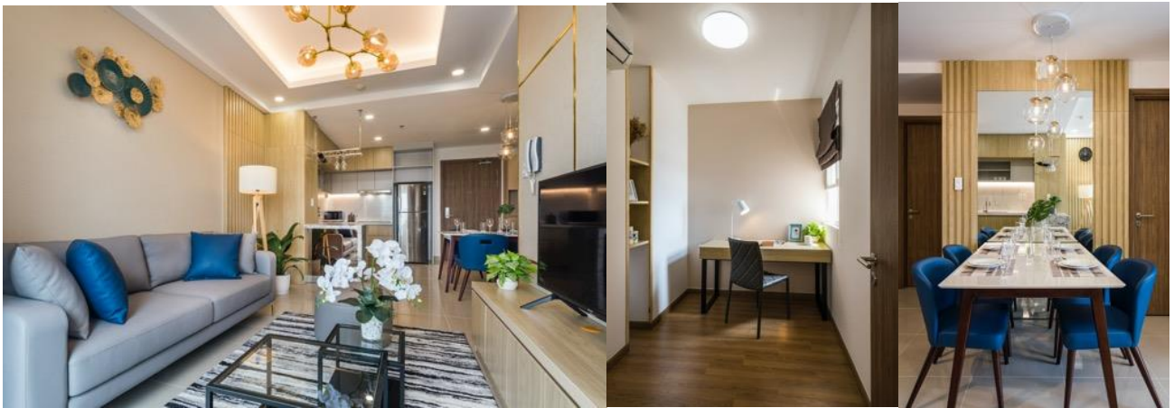
Căn hộ 2 phòng ngủ (Hình bên trái: phòng khách, hình giữa: phòng làm việc, hình bên phải: phòng ăn)