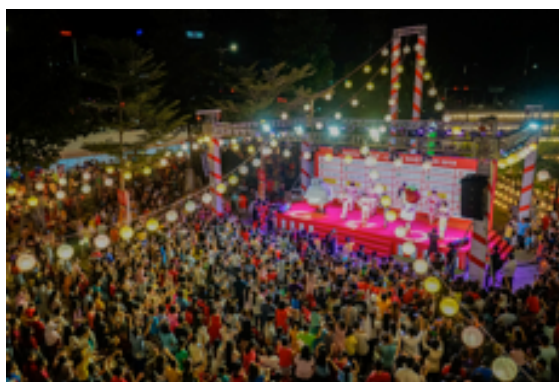
東急グループジャンフェスティバルの様子