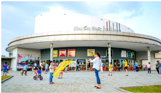
hikariフードコートの外観