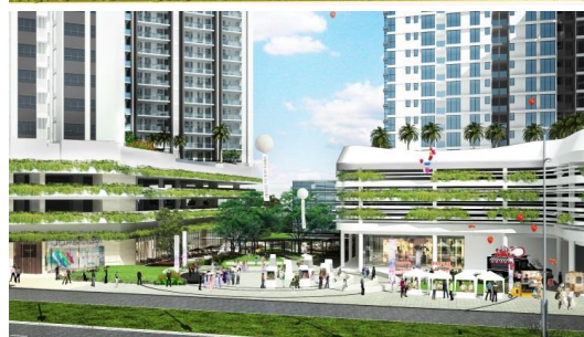
Bể bơi phục vụ cư dân (hình trên) Khu thương mại tầng trệt (hình dưới)