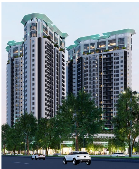
Thiết kế hình chữ X đặc trưng