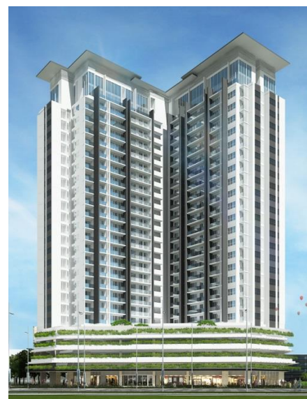
Phôi cảnh dự án sau khi hoàn thành

Tỉnh Bình Dương là tỉnh có dân số hơn 2 triệu người, tiếp giáp với phía bắc của Thành Phố Hồ Chí Minh, thành phố lớn nhất của Việt Nam. Bình Dương là một trong những tỉnh tích cực thu hút đầu tư nước ngoài tại Việt Nam, tự hào với thành tích thu hút hơn 3,000 dự án đầu tư trực tiếp nước ngoài (FDI), đứng thứ 3 sau Thành Phố Hồ Chí Minh và Thành Phố Hà Nội. Những năm gần