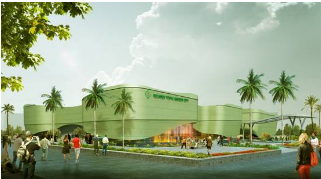
(Khu căn hộ mẫu với thiết kế thống nhất với sắc xanh liên tưởng đến vườn cây)