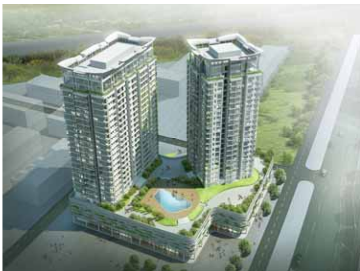
(4階屋上には空中庭園を設置)